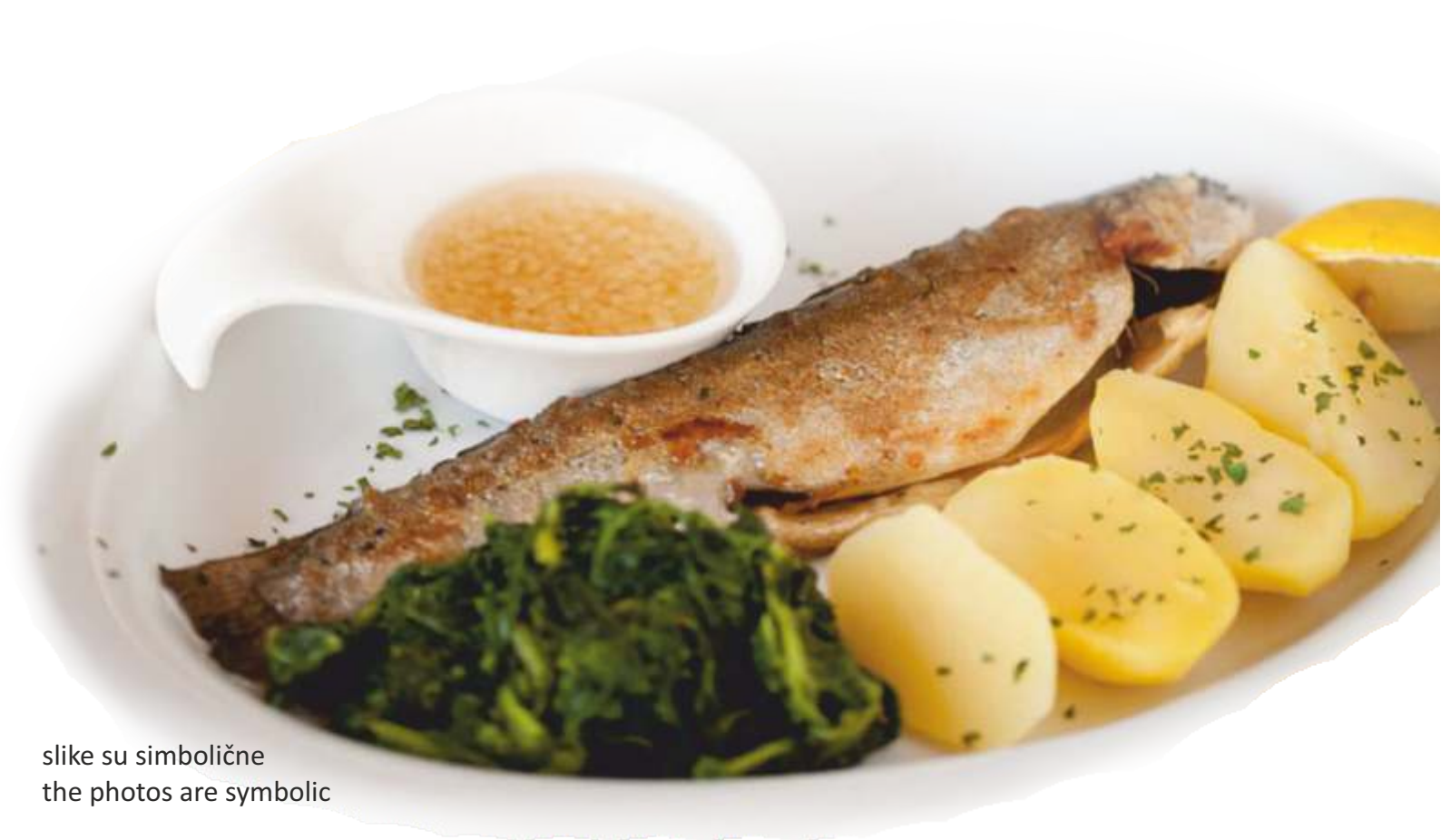
slike su simbolične the photos are symbolic

PRŽENE LIGNJE, TARTAR 🍴🍴🍴🍴 .....55,00 KN FRIED CALAMARI, TARTAR SAUCE